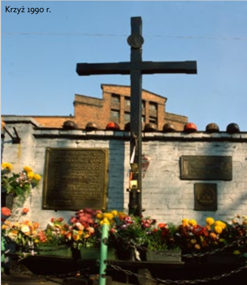
Krzyż 1990 r.