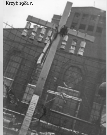
Krzyż 1981 r.