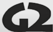
Gimnazjum nr 2 z Oddziałami Dwujęzycznymi w Katowicach ul. B. Głowackiego 4 40-052 Katowice